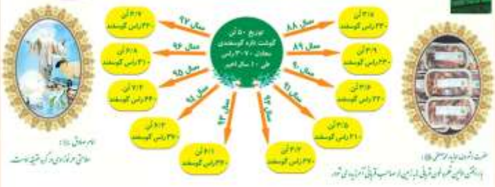
توزیع گوشت نذورات قربانی طی ۱۰ سال اخیر

بهدارگرایی توزیع گوشت نذورات قربانی و عقیقه نیکوکاران طی - ۱۰ سال اخیر