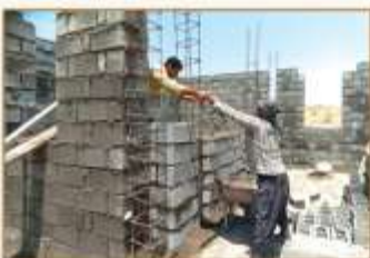
دیوار خانه ما از مهر انسان شما دیوار شد.