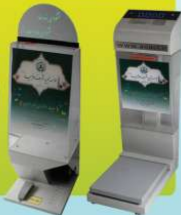
پدالی شماره ۳