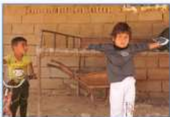
ای کودکان! آنگاه بر مسافت تو در آن خربه چکار؟