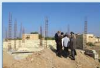
با سرعت توکل را عهدنامه کرده ایم