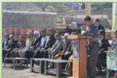
بر این رونق برآمد نبشته اند به زر که هر نیکنی فعل کرد بخواند ماند