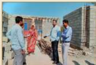
جواهر بر این جنده پوست که می زنداید هم من را!