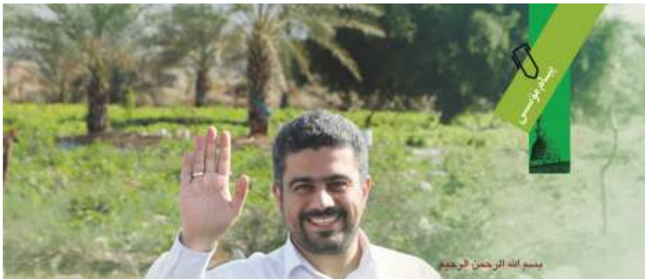
مسم الله الرحمن الرحيم