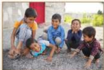
ما سائله میخندیم تا تر سنیز رنج ایام ، بیروز میدان شویم