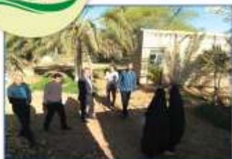
آن پیش می‌دانم امروزترین نگاه‌ها، بر سخلات سکونت، گره‌بند همسانی‌ها خواهد بود.