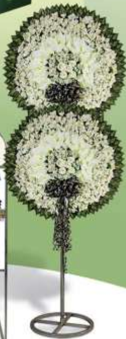
تاج گل و تندیس تسلیمت