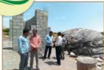
جان ها نمای مردم نیگو نهاد بات