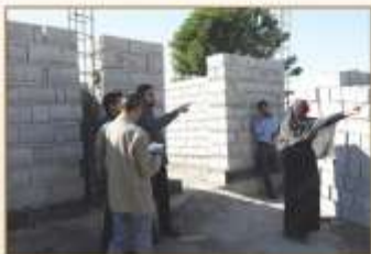
خواهر رنج دیده ام این خانه برای نوست ، باشد که بمانی