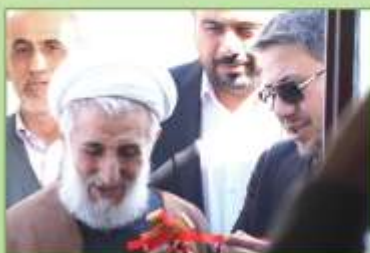
ایمن پهنر مبارکت باد ...