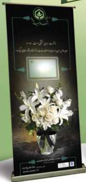
استند تسلیمت (با طرح های متفاوت)