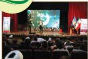
نوازگان تیل اروپیش خود به دست آور که بجزون تیر و گنج تیرم بفرستد ماند