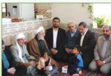
کوهکلی نعل شگسته سرزمینو ا جمع ما را گنبدان کرده اند