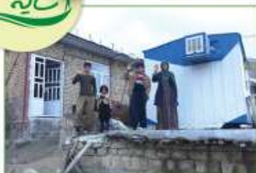
نیاستد همی ننگ و بد پایدار عسل به که نیکن بود یادگار