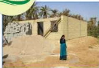
تازه‌ای که بی گسرت نیست...