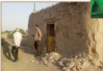
هنوز کوشی هست !! ... مگر کجاش نشینان هنوز هم هستند!!